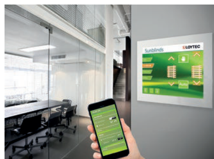
Intuitive Jalousiesteuerung mit Smartphone und L-VIS Touch Panel

und auch bei der Umsetzung von Raumautomationslösungen einer Vielzahl von Herausforderungen gegenüber.