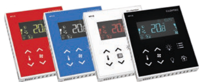
L-STAT Raumbediengeräte – ideal für die gewerkeübergreifende Raumbedienung

alles Kopfzerbrechen über oben beschriebene Anforderungen und Fragen nun der Vergangenheit angehört. Eingebettet in einem kompakten Stahlblechgehäuse zur Installation in der Zwischendecke oder im Doppelboden bieten die Raumcontroller On-Board-Schnittstellen zu BACnet (IP und MS/TP), LON-IP, KNX (IP und TP1), Modbus (TCP und RTU, Master oder Slave), OPC, DALI, SMI, MP-Bus und EnOcean. Aufwendige und kostspielige Gateway-Lösungen – zum Beispiel zur Integration in ein Gebäudemanagementsystem – sind damit nicht mehr nötig. Alle drei Modelle – L-ROC-400, L-ROC-401 und L-ROC-402 – verfügen über zwei EthernetPorts, die wahlweise im Switch-Modus oder in getrennten Netzwerken betrieben werden können. Über den integrierten Webserver können kundenspezifische Bediengrafiken und sogar Grundrissvisualisierungen bereitgestellt werden, die als HTML5 Seite über jeden beliebigen Webbrowser oder über einen WindowsPC bedient werden können. Natürlich wird die Integration in das L-WEB-900 Gebäudemanagementsystem unterstützt und sogar die Anbindung an Systeme anderer Hersteller ist problemlos möglich, da alle bedeutenden Standardprotokolle unterstützt werden.