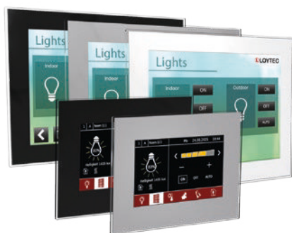
L-VIS Touch Panel Varianten – vollendetes Design für höchste Ansprüche

Ob im Einzelraum, im Konferenzraum oder als zentrales Bedienteil in Großraumbüros – L-VIS Touch Panels machen mit Ihrem zeitlosen Design überall eine gute Figur. Die Panels unterstützen gleichzeitig BACnet, LON, Modbus und OPC. Erhältlich in den Größen 7, 12 und 15 Zoll integrieren Sie sich nahtlos über IP in das L-ROC System.