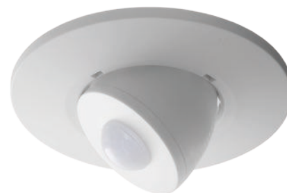
L-DALI Multisensor zur Präsenzerkennung und noch viel mehr

Kein energieeffizientes Raumautomationssystem ohne Präsenzerkennung im