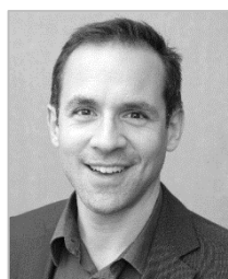
Leo Putz Avelon AG